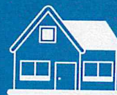
Online aplikace Katastru nemovitostí